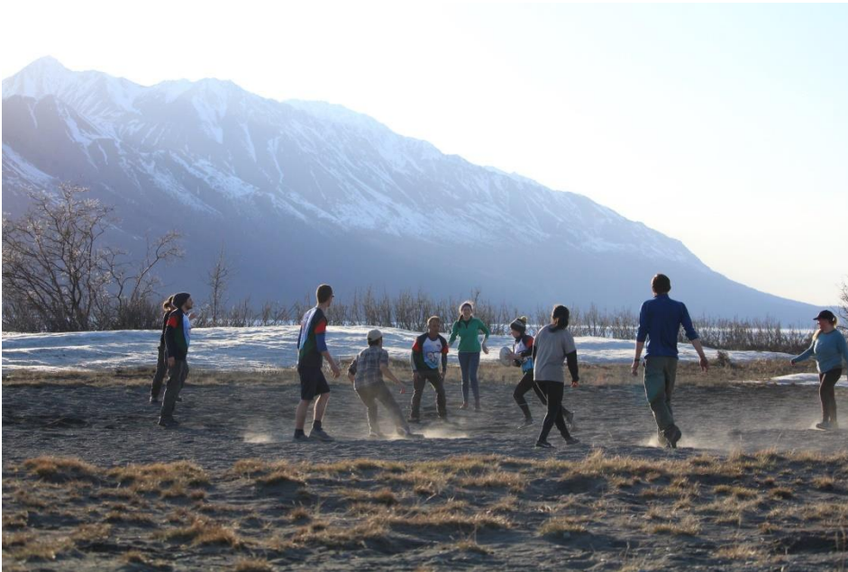
Jeudi soir : Rugby sur la plage